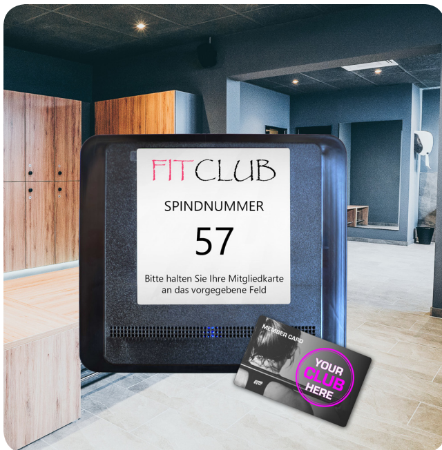
ID SPIND MASTER ist kompatibel mit dem ID LOCK 3500 und zeigt vergessene Spindnummer an