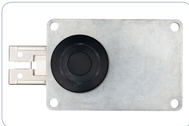
ID LOCK 3000