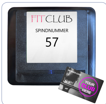
Anzeige der Spindnummer beim Heranhalten des RFID Mediums